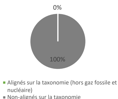
1. Alignement des investissements sur la taxonomie, obligations souveraines comprises*